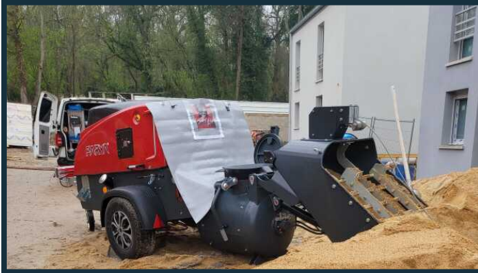
Die Heckschutzplane schützt die Haube vor Verschmutzungen