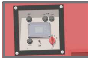
Einfach zu bedienende Kontrolleinrichtung