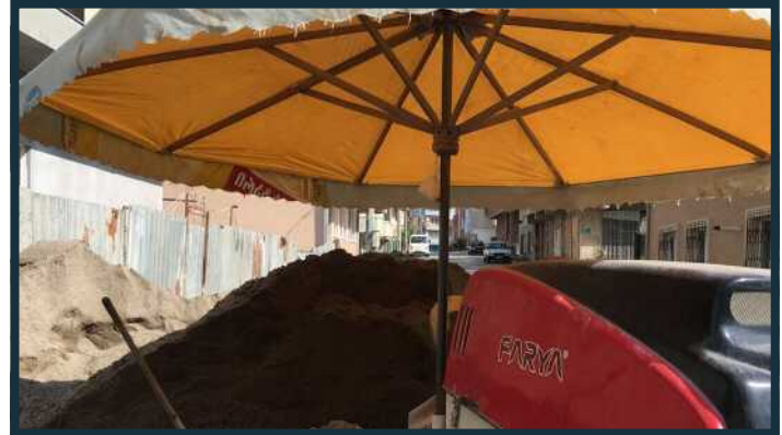
Die Schirmvorrichtung schützt vor Regen und starker Sonne

Unsere Maschine ist stets für den harten Einsatz auf der Baustelle einsatzbereit.