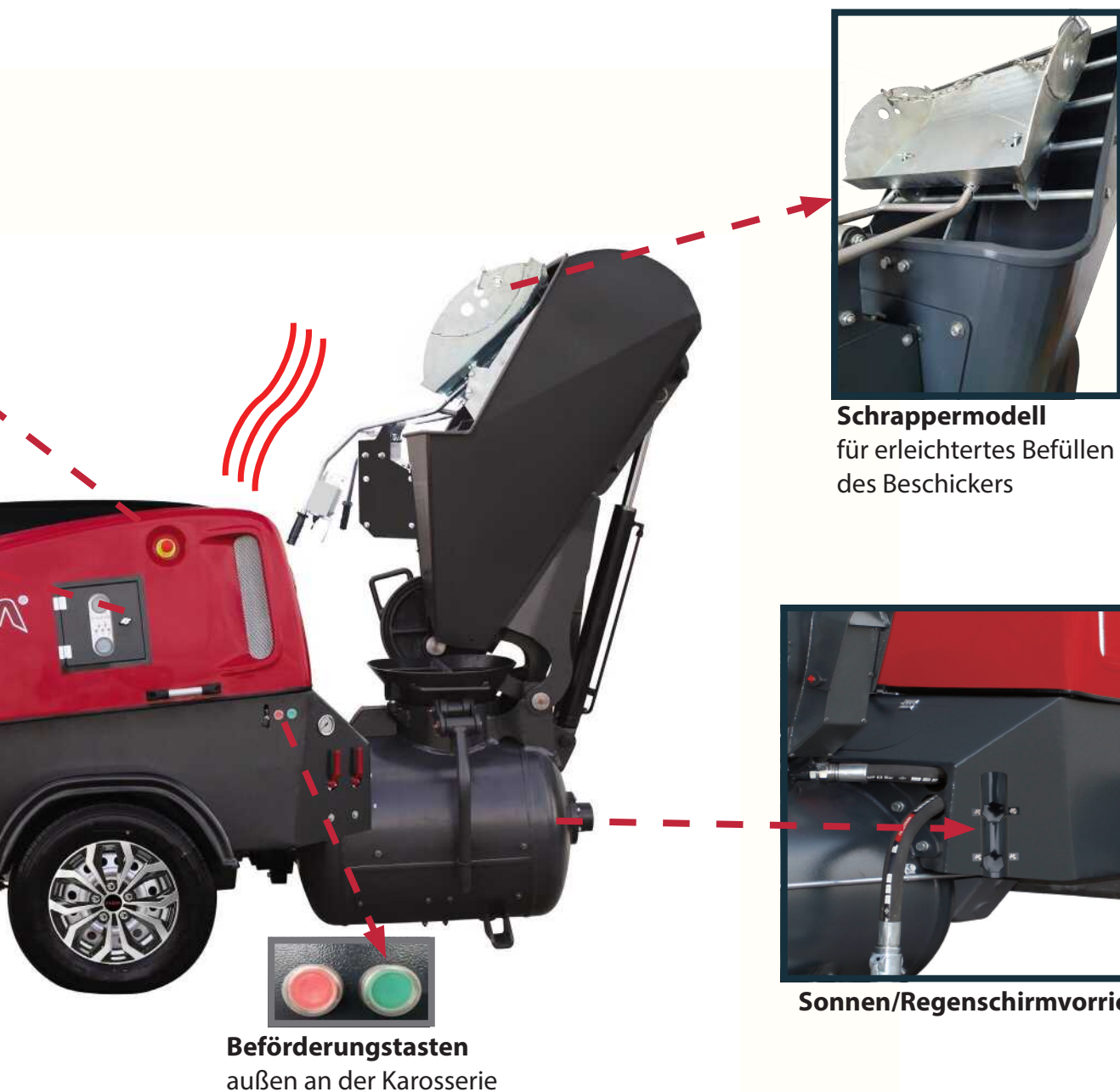
Schrappermodell für erleichtertes Befüllen des Beschickers